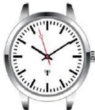
Ilustracja 3: wyłączenie DST