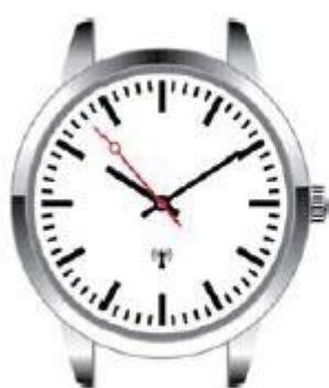
Ilustracja 1: Automatyczny DST