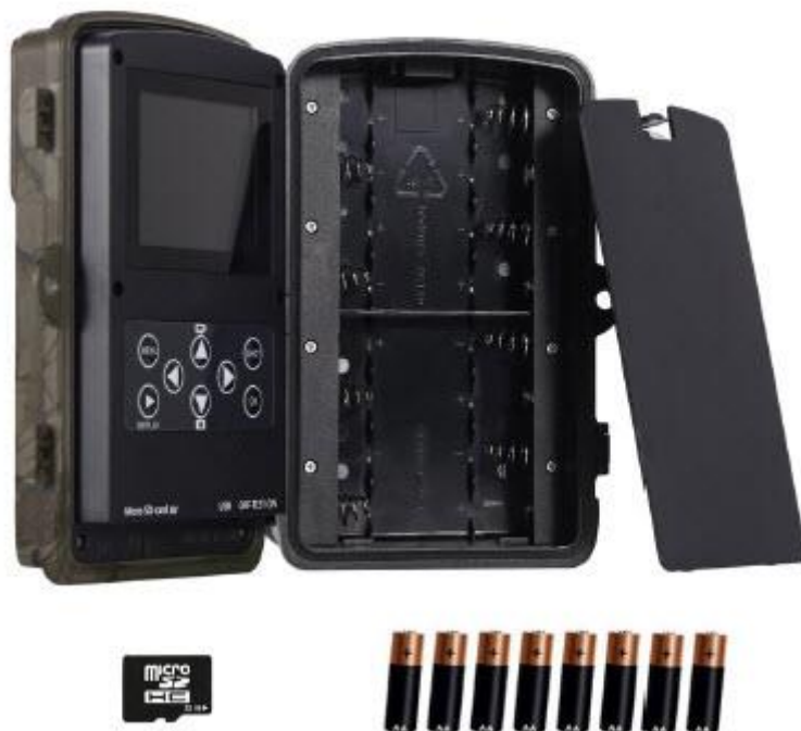
Karta Micro SD 32 GB 8 x bateria AA