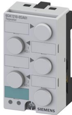
SIMATIC NET, Repeater für AS-Interface zur Leitungsverlängerung im K45 Gehäuse