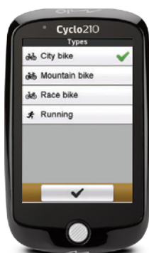
Profile - Bike Type