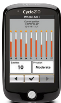
Where Am I Function