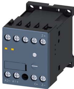
Ausschaltverzögerer, DC 24 V, für Hilfs- und Motorschütze 3RT2