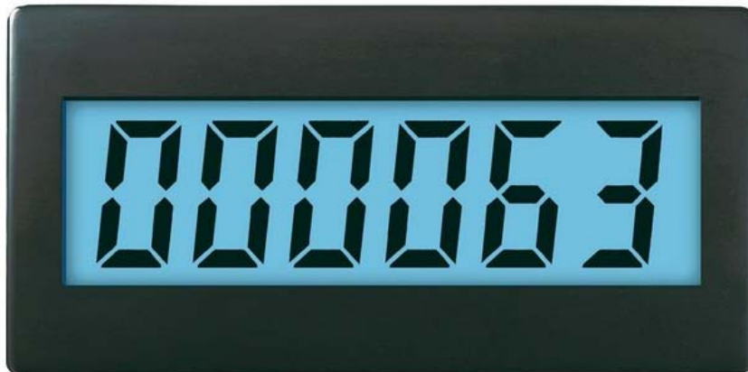
6-mestni vgradni števec