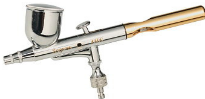
Brizgalna pištola AB 430 Št. artikla: 23 26 03