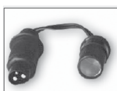
Vtič Bikestart® BS22