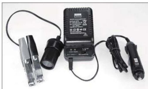
Z vtičem za cigaretne vžigalnik ali natičnim adapterjem s kleščami

Za čiščenje ohišja uporabite mehko krpo in malce blagega čistilnega sredstva. Močnih topil kot so razredčila ali bencin ter abrazivnih sredstev ne smete uporabljati, saj napadajo površino naprave. Čistilne krpe in odvečno čistilno sredstvo odstranite okolju prijazno. Pred čiščenjem je treba iz varnostnih razlogov napravo ločiti od električnega omrežja in polnilni kabel ločiti od akumulatorja! Preprečite, da čistilna sredstva zaidejo v notranjost naprave!