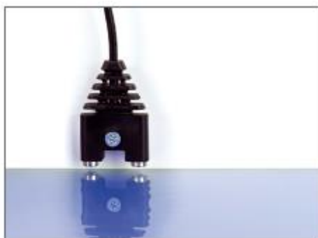
Primer montaže (vodni senzor)