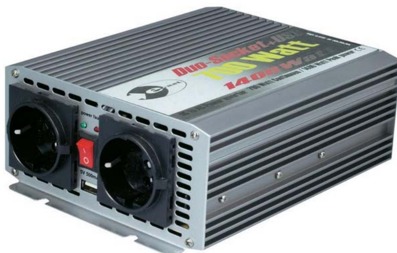
Trapezni razsmernik Št. izdelka: 514916

Navodila za uporabo so sestavni del izdelka. Vsebujejo pomembne napotke za pripravo na zagon in uporabo. Če izdelek predate tretji osebi, poskrbite za to, da ji izročite tudi ta navodila za uporabo.