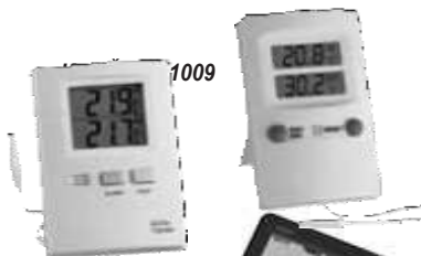
Kat. Št. 30.1012