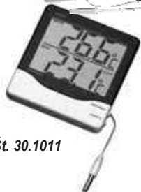
Kat. Št. 30.1011

Navodila za uporabo Digitalni notranji zunanji termometer