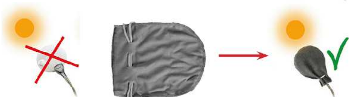
Zaščitni ovitek za lečo

Lupe ne izpostavljajte neposredni sončni svetlobi! S fokusiranjem svetlobnega snopa lahko povzročite požar!