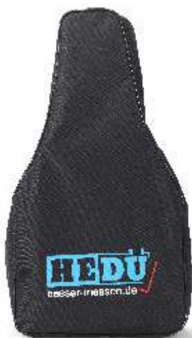
Torbica, št. izd. E806-1