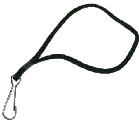
Trak, št. izd. E806-2