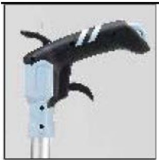
Ročaj s ponastavitveno tipko in ustavitveno tipko