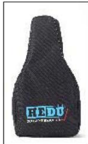
Dostava skupaj s torbico