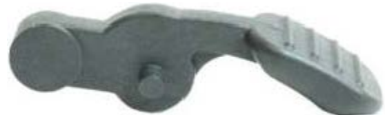
Ponastavitvena tipka, št. izd. E806-8