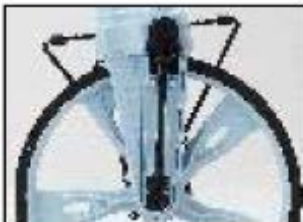
Pogonjanje števca prek gonilnega droga