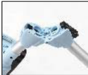
Robusten zložljivi mehanizem