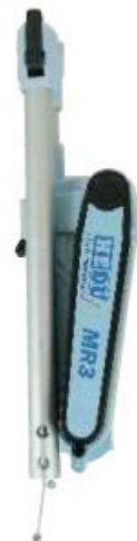
Osnovni okvir s števcem, vrvico in držalo za os, št. izd. E806-4