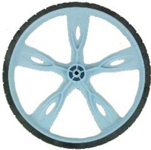
Kolo, št. izd. E806-5