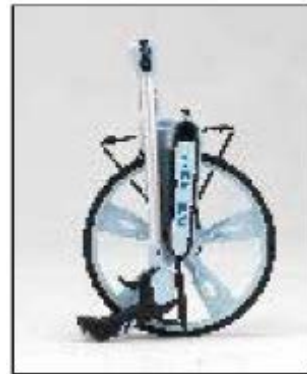
V zloženem stanju samo 53 cm