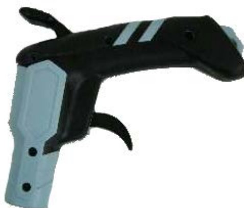
Ročaj v obliki pištole, št. izd. E806-3