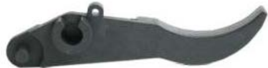
Zavorna ročica, št. izd. E806-9