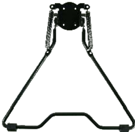
Stojalo, št. izd. E806-7