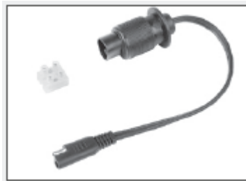
Vtič Bikestart® BS25

BAAS bike parts Burgstr. 15 D-74232 Abstatt-Happenbach Nemčija