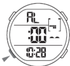
Funkcija bujenja (AL)