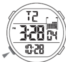
Čas drugega časovnega pasu (T2)