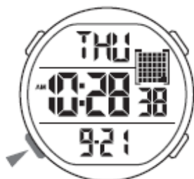
Čas z datumom