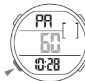
Funkcija narekovalca tempa (PA)

→ Funkcija narekovalca tempa narekuje tempo, ki ga lahko uporabljate pri različnih vrstah športa (npr. pri teku) kot izhodišče za potek premikanja (npr. frekvenca korakov). Ura pri tem predvaja zvočne signale v nastavljeni frekvenci.