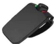
Parrot MINIKIT Neo 2 HD