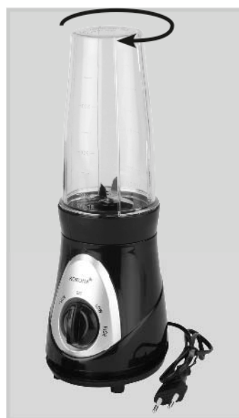
Rezilo privijte v smeri urinega kazalca