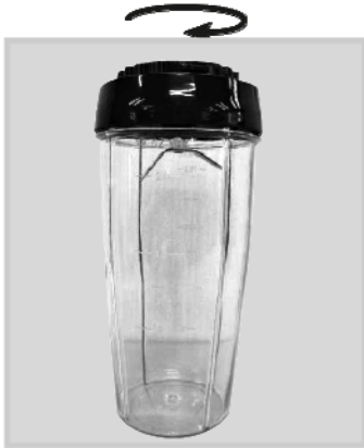
Sestavljeno rezilo pritrdite v smeri urinega kazalca