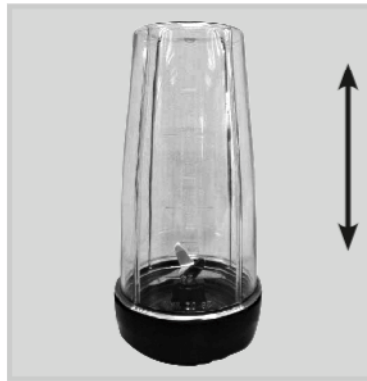
Posodo za mešanje obrnite na glavo