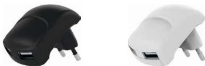
Slika 1: Vtična polnilnika

Ta izdelek je vtični polnilnik za polnjenje in napajanje majhnih prenosnih naprav prek vtičev, ki so primerni za posamezne naprave, ali USB-priključka. Pretvarja omrežno napetost v majhno napetost 5 V.