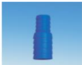
Priključek za prezračevalnik C1.0605.01