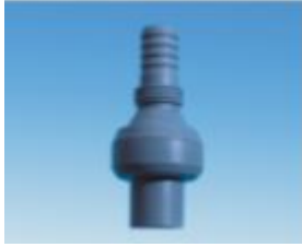
Nepovratni ventil z zračenjem 3004.53.00