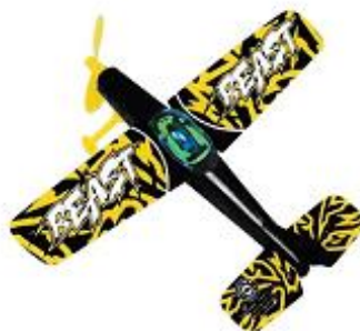
Gummimotor-Flugmodell / Rubber band powered plane