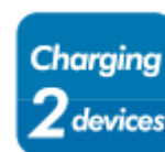
Polnjenje dveh naprav