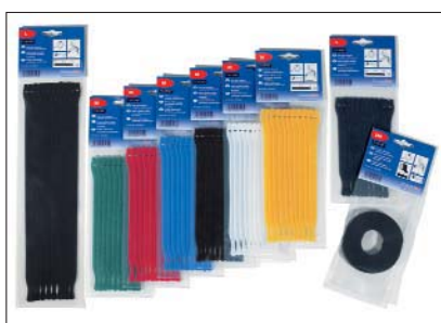
TEXTIE®-Serien finns i olika färger och längder.

Fästen, GTM serien, kan fås på begäran. Kontakta oss!