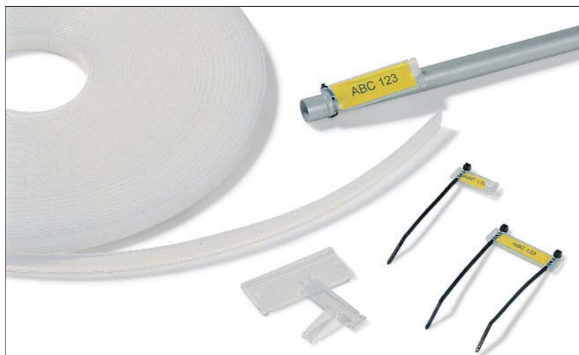
Mångsidig märkning: Helafix HC och HCR.

Vi rekommenderar HFX etiketter utskrivna på en vanlig kontorslaserskrivare, använd mjukvara TagPrint PRO.