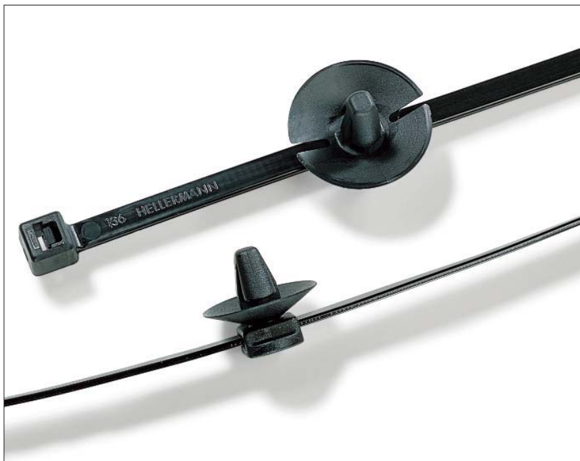
Fördelen med en 2-parts montering är att buntbandet kan placeras i den bästa positionen.

Ursprungligen utformad för att fixera kablage inom fordonsindustrin men detta smidiga buntband används numera inom många olika områden från flygplan, till högspänningsbrytare, till tvättmaskiner.