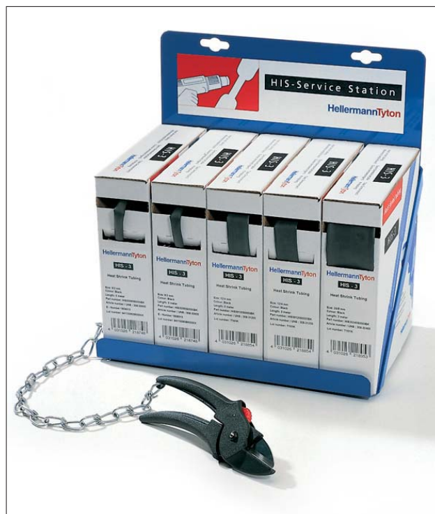
HIS-Påfyllningsställ med 5 boxar och specialverktyg.