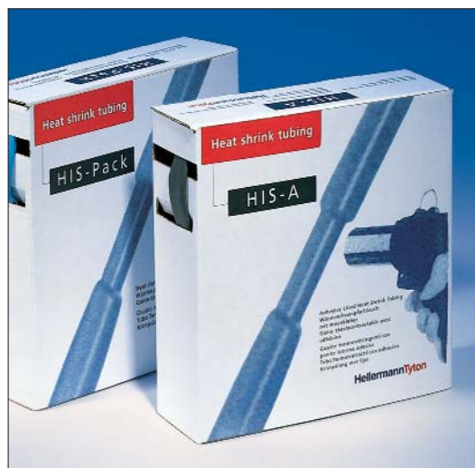
HIS-A med lim och HIS-Pack.