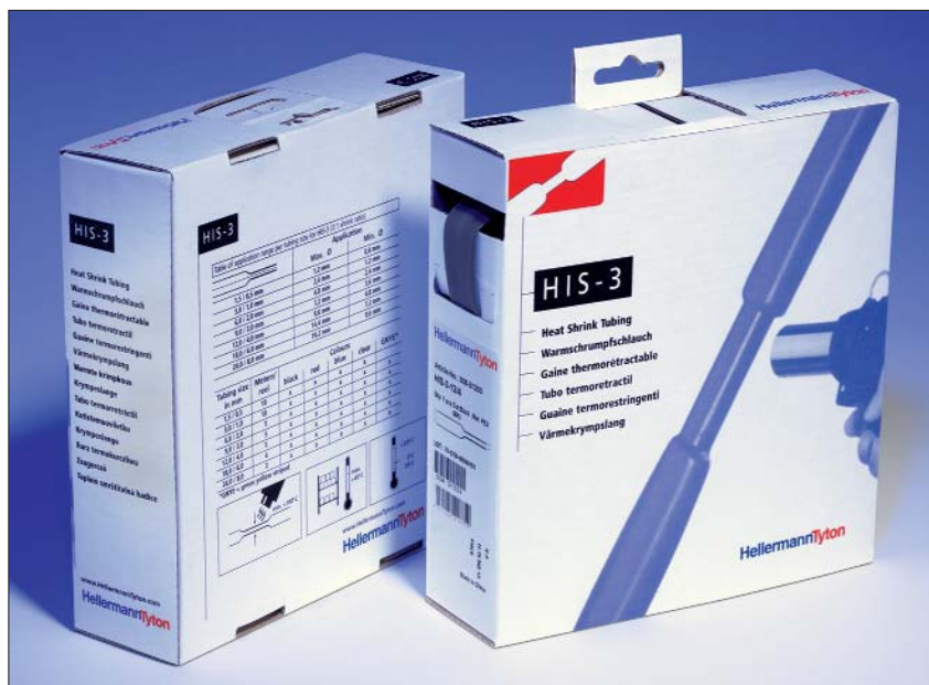
HIS-3 täcker många olika diameterstorlekar.