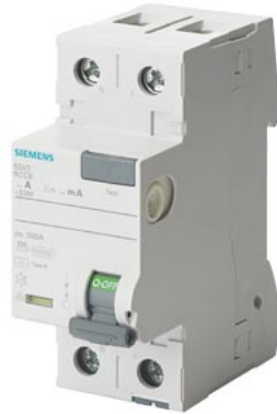
FI-Schutzschalter, 2-polig, Typ A, In: 63 A, 30 mA, Un AC: 230 V, N-links