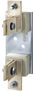
NH-Sicherungsunterteil Gr. 4, 1-polig 1250A, 690V Flachanschluss