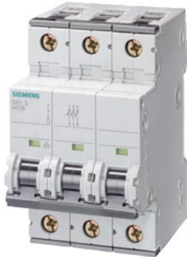
Leitungsschutzschalter 400V 10kA, 3-polig, A, 1A, T=70mm