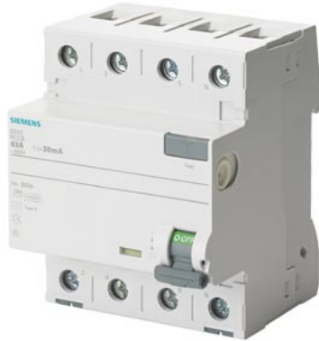
FI-Schutzschalter, 4-polig, Typ A, In: 63 A, 300 mA, Un AC: 500 V